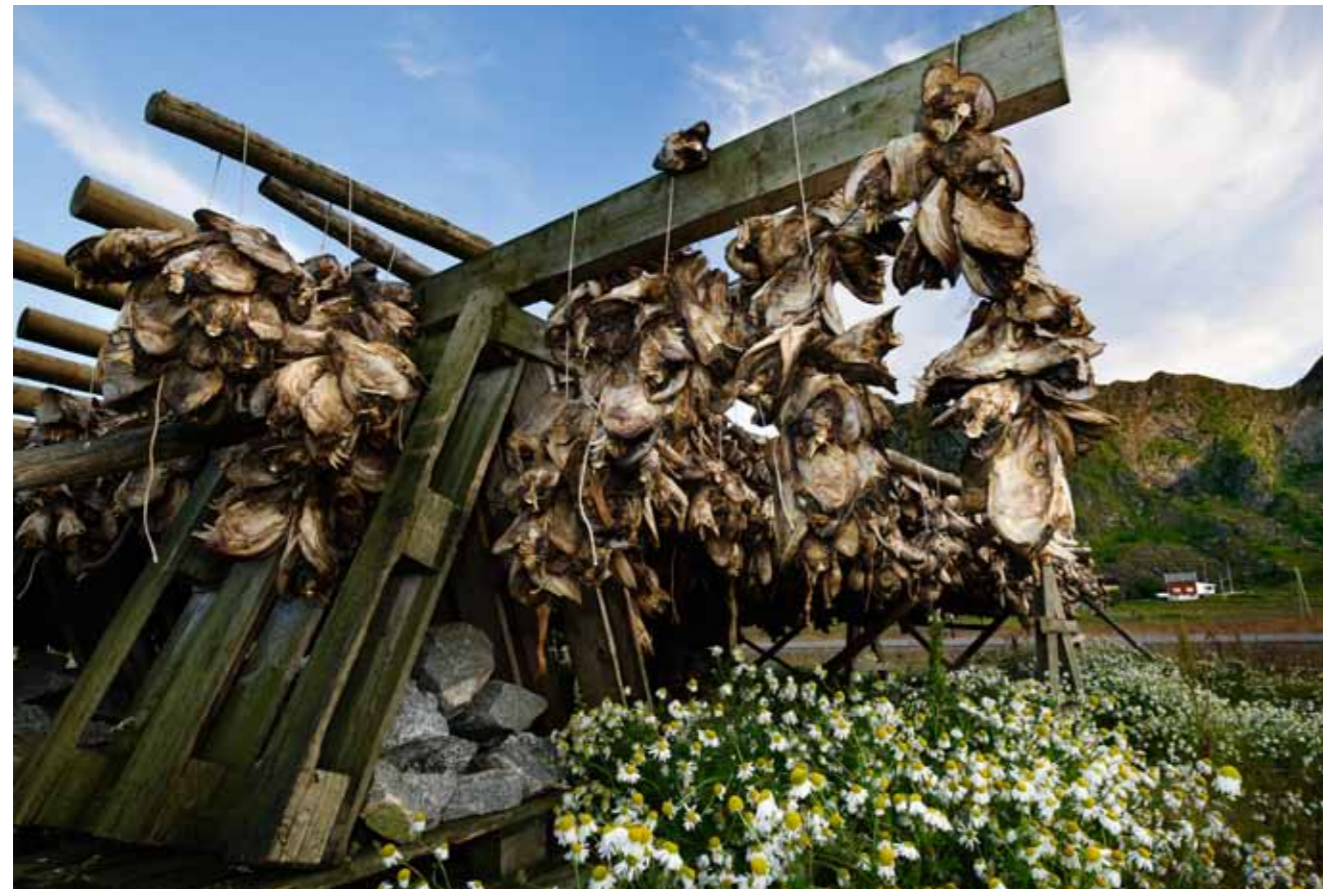
In het voorjaar hangt overal op de eilanden stokvis te drogen, zoals hier op Vaelroy. Rechterpagina: De replica's van Vikingschepen van museum Lofotr geven een blik terug in de tijd. Vorige pagina's: Traditionele huisjes in het oude vissersdorp Å op Moskenesøya.

Het leek er een tijdlang op dat de kabeljauw aan het verdwijnen was uit de wateren rond de Lofoten, door overbevissing op de Barentszee. Maar vorig jaar winter is het tij gekeerd – tot